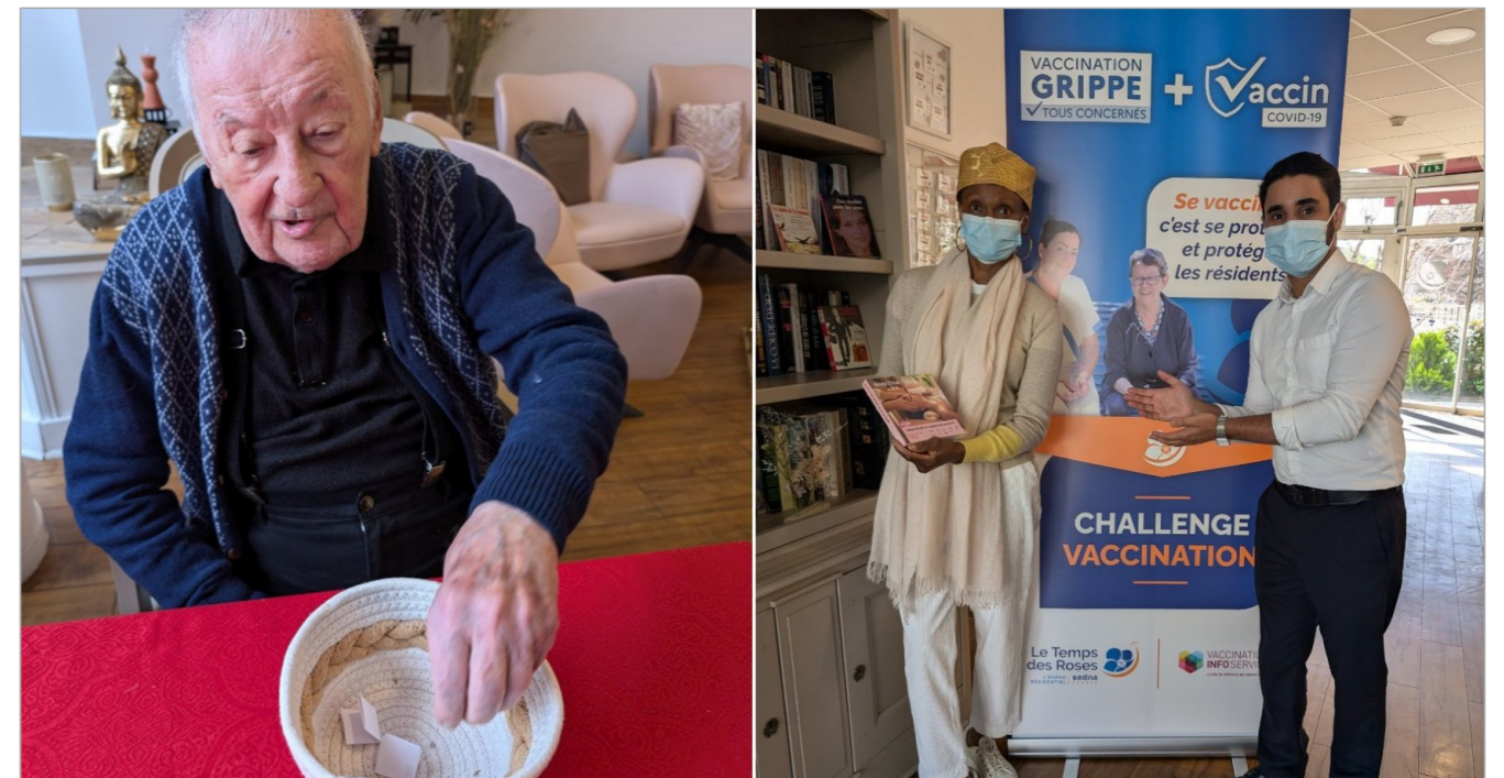
Dans le cadre de la campagne de vaccination, notre résidence a organisé un tirage au sort effectué par les résidents et la remise des cadeaux par le directeur. Bravo aux gagants.