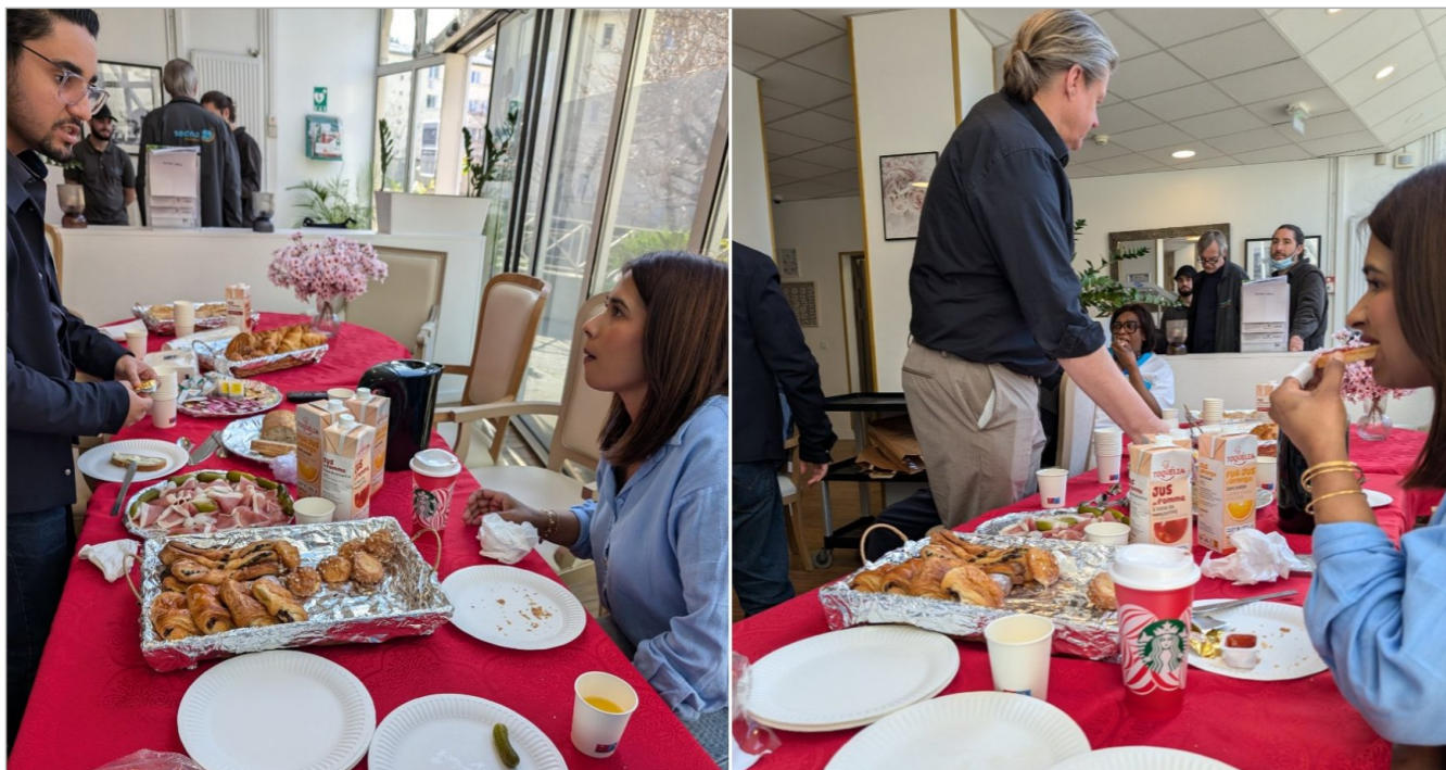
Un premier petit déjeuner du personnel special brunch pour remercier tout le personnel.