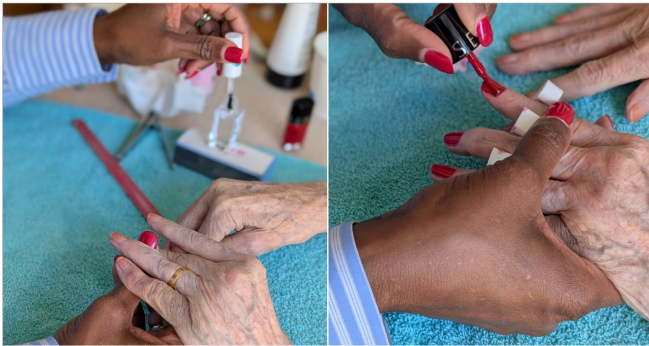
Atelier manucure en chambre: est un moment très apprécié par les résidents, elle permet d'entretenir les ongles mais aussi d'offrir un moment de détente et de convivialité