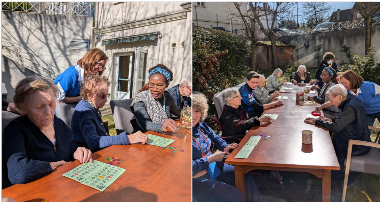
Profiter du beau temps pour organiser une partie de bingo en extérieur est une excellente idée pour rassembler les résidents et partager un moment convivial.