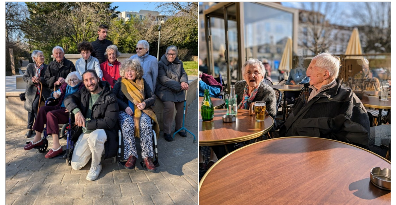
Rien de plus agréable que de profiter du beau temps pour faire une balade au parc et faire une pause au café.