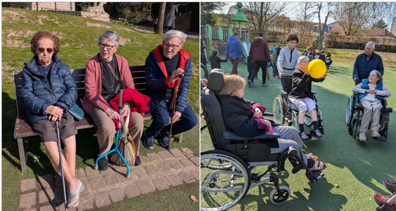
Nous avons profité du soleil pour faire une sortie au parc et jouer au volet ball. Ce fut un moment très convivial, et bien profiter des uns et autres.