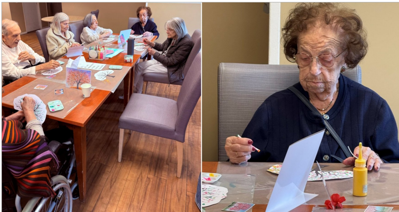
Notre atelier art thérapie sur le thème du printemps nous permet d'exprimer la renaissance, le renouveau et la vitalité à travers la créativité.