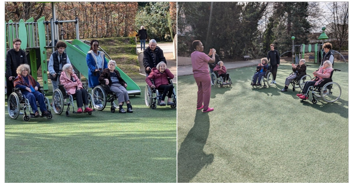
Nous avons organisé une sortie au parc de la mairie et y faire des activités en plein air comme de la gym douce et une course de faureuil roulant , ce fut un moment convivial et les résidents étaient contents ainsi que les familles présentes.