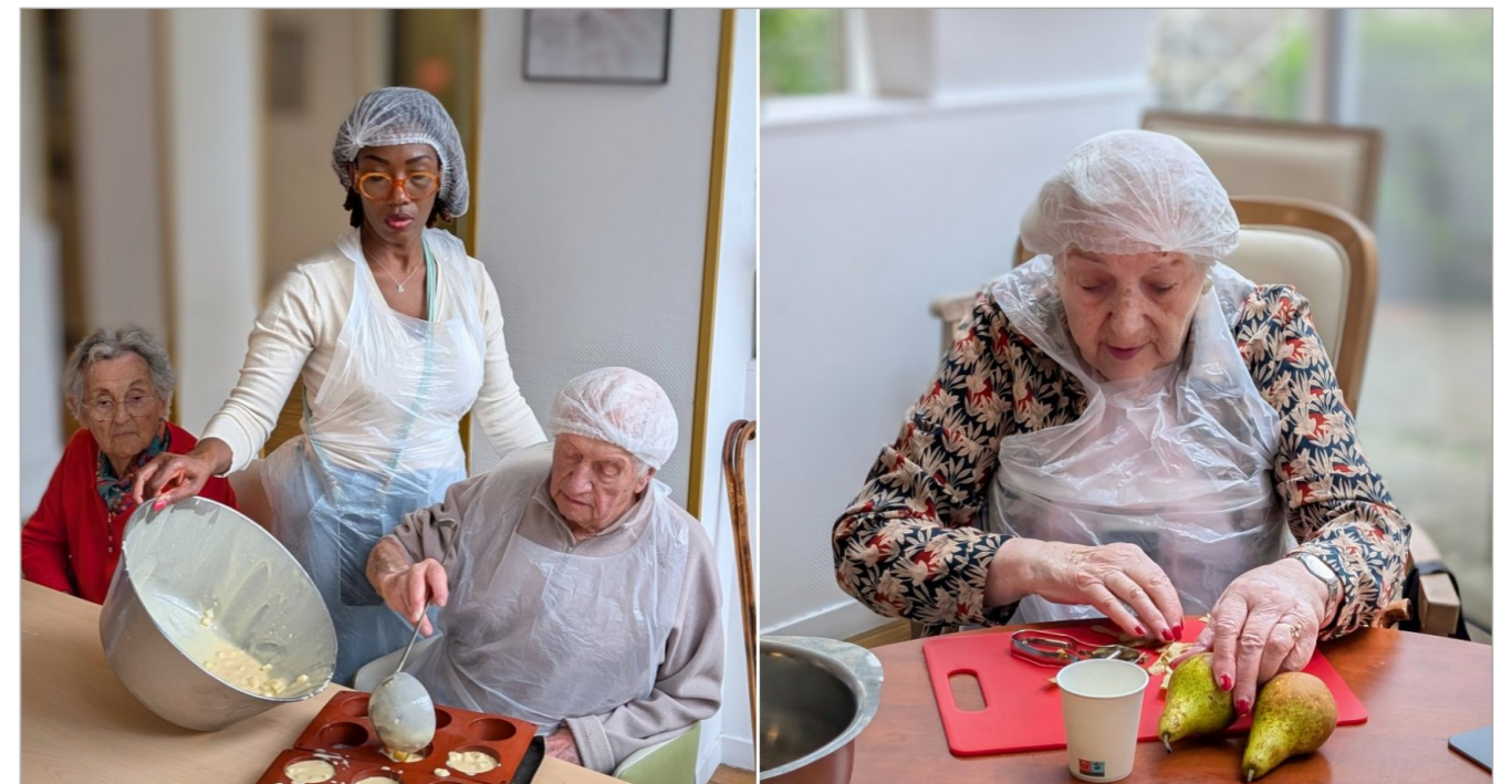
Pour cette semaine, nous sommes partis sur un gâteau au yaourt à la poire, notre moment de partage en groupe, de convivialité et surtout les souvenirs du bon vieux temps qui remontent. Pendant ce temps les résidents partagent des anecdotes culinaires.