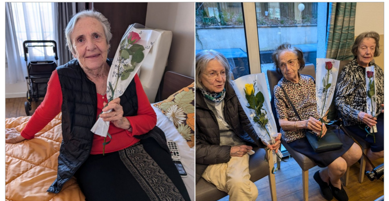
Le 08 mars était la journée mondiale de la femme, nous avons organisé un après-midi spécial femme en mémoire des femmes qui ont impacté notre monde. Nous avons fait la distribution de roses à toutes les femmes de la résidence.