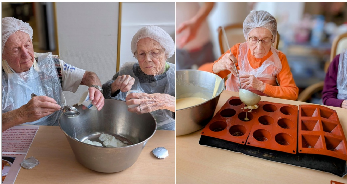
C'est vendredi, le jour de notre atelier pâtisserie et nous sommes partis sur le gâteau de notre enfance "gâteau au yaourt", ce moment qui nous rappelle beaucoup de souvenir .